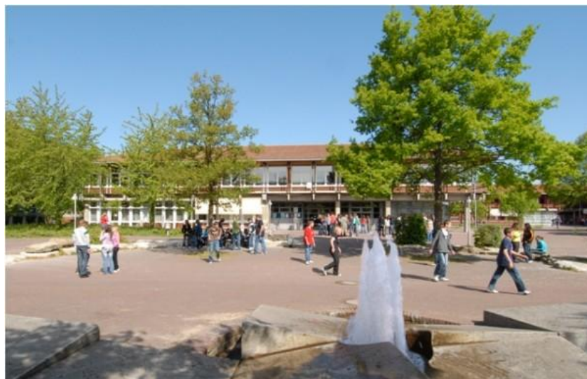
Wirtschaftsschule Bad Windsheim

Die Ziele, Maßnahmen und Aktivitäten der Staatlichen Wirtschaftsschule Bad Windsheim, während der Qualifizierungsphase, werden in einem Medienentwicklungsplan (MEP) ausführlich dokumentiert. Der MEP wird jeweils zum aktuellen Projektstand aktualisiert und auf unserer Homepage www.ws-bw.de/ sowie bei www.yumpu.com/de/ veröffentlicht.